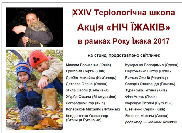
Рис. 11. Інформаційна сторінка стенду зі світлинами, представленими на фотоконкурс з нагоди Року їжаків в Україні (2017) в рамках акції «Ніч їжаків» на 24 Теріологічній школі (Одеса, 2017); організація конкурсу була силами авторів цієї статті за участі оргкомітету конференції. Переможцем конкурсу було фото, представлене тут на рис. 2б.

Один з найочевидніших, найпростіших і одночасно найуспішніших – проведення фотоконкурсів типу «їжак в об'єктиві». Подібну форму активності (поміж інших) успішно зреалізовано на 24 Теріологічній школі Українського теріологічного товариства 2017 р. в Одесі (рис. 11). Там в рамках акції «Ніч їжаків» було проведено фотоконкурс (Barkaszi, Gaydash 2019), фото переможця якого прикрасило обкладинку тому 15 журналу товариства, «Праці Теріологічної школи», нині відомого як Theriologia Ukrainica .