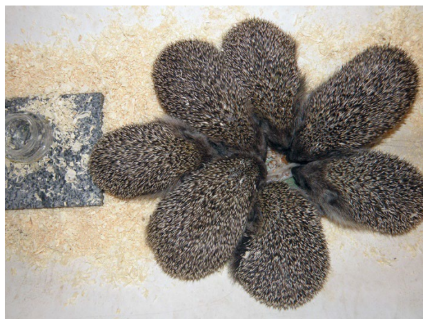
Рис. 7. Їжаченята на відгодовілі: (а) годування малюка вагою 53 г із соски молочною сумішшю (2.09.2020); (б) їжаченята біля миски зі шматочками м'яса (15.07.2021)