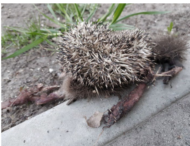
Рис. 4. Їжаки як жертви міських негараздів: (а) рештки їжака, з'їденого здичавілими псами, урочище Лиса Гора, 12.05.2023, (б) їжак, що загинув від авто і був доїдений вороною сірою (проспект Вернадського, 29.04.2019)

Fig. 4. Hedgehogs as victims of urban problems: (a) the remains of a hedgehog eaten by feral dogs, Lysa Hora tract, 12.05.2023; photo by I. Zagorodniuk; (b) hedgehog killed by a car and eaten by hooded crow (Vernadsky Avenue, 29 April 2019); photo by O. Kalynychenko