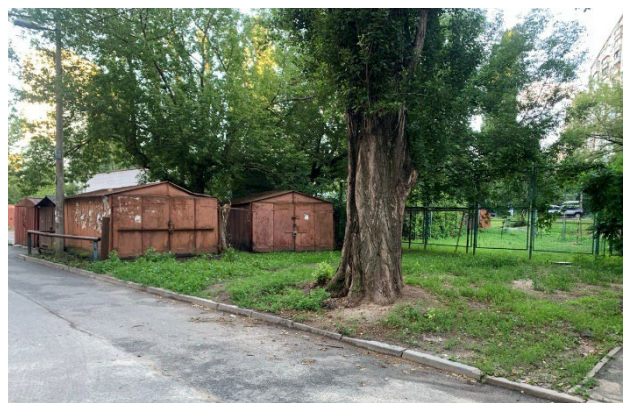
Рис. 2. Типові місцезнаходження їжаків на межі селітебних і природних зон (google.map): (а) зона промислових площадок, рекреації та одноповерхової забудови в заплавної частині міста; (б) гаражний кооператив між забудовою і Голосіївським нацпарком; (в) прибудинкові гаражі з захарашеним міжгаражним простором, в якому виявлено сховище їжаків, у дворі біля Центрального автовокзалу

Fig. 2. Typical locations of hedgehogs on the border between residential and natural areas (google.map): (a) area of industrial sites, recreation and single-storey buildings in the floodplain part of the city; (b) garage cooperative between the buildings and Holosiivskyi National Park; (c) garages attached to a building with cluttered inter-garage space, in which a hedgehog shelter was found, in the courtyard near the Central Bus Station