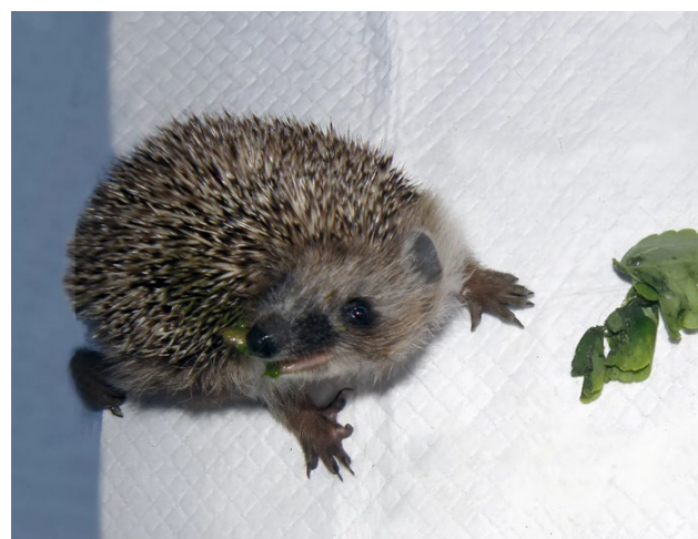
Рис. 9. Їжак, зайнятий облизанням своїх боків для зменшення запахів, принагідно використовує для цього рослинний матеріал; 06.03.2025

( Stenactis annua ), пожував їх (подібно тому, як це роблять і дорослі їжаки) і обмазав слиною свої голки на боках тіла. Коли за три тижні його винесли на прогулянку на двір, він те саме зробив з травою (пожував і змазав слиною свої голки). У дорослішому віці він використовував всі нові запахи, щоб перенести їх на себе. Пізніше надавав перевагу запахам заліза (труба у ванній кімнаті), кропиви та парфумів.