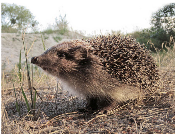
Рис. 1. Їжаки з околиць Києва: (а) Ходосіївка, після душу, 02.07.2017; Вишеньки, 16.07.2017.