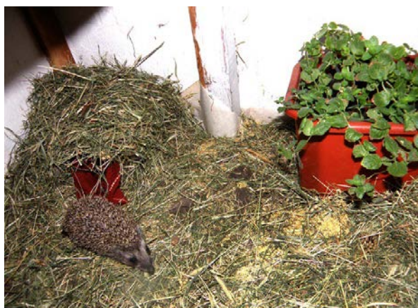
Рис. 6. Облаштовані місця проживання їжачка в міській квартирі, на балконі: (а) їжаченя-сирота, поселене в клітці, 14.06.2021; (б) літня будка (07.08.2020); (с) зимове гніздо з сіна і шматків шерстяного одягу (07.09.2021)