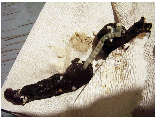
Рис. 5. Молодий «весняний» їжак з екостежки в Голосіївському НПП, всіяний на боках (а) і на череві (б) численними кліщами Ixodes cf. ricinus (21.05.2020); Внизу – цестода та її проглотиди в посліді їжака, попередньо Hymenolepis erinacei