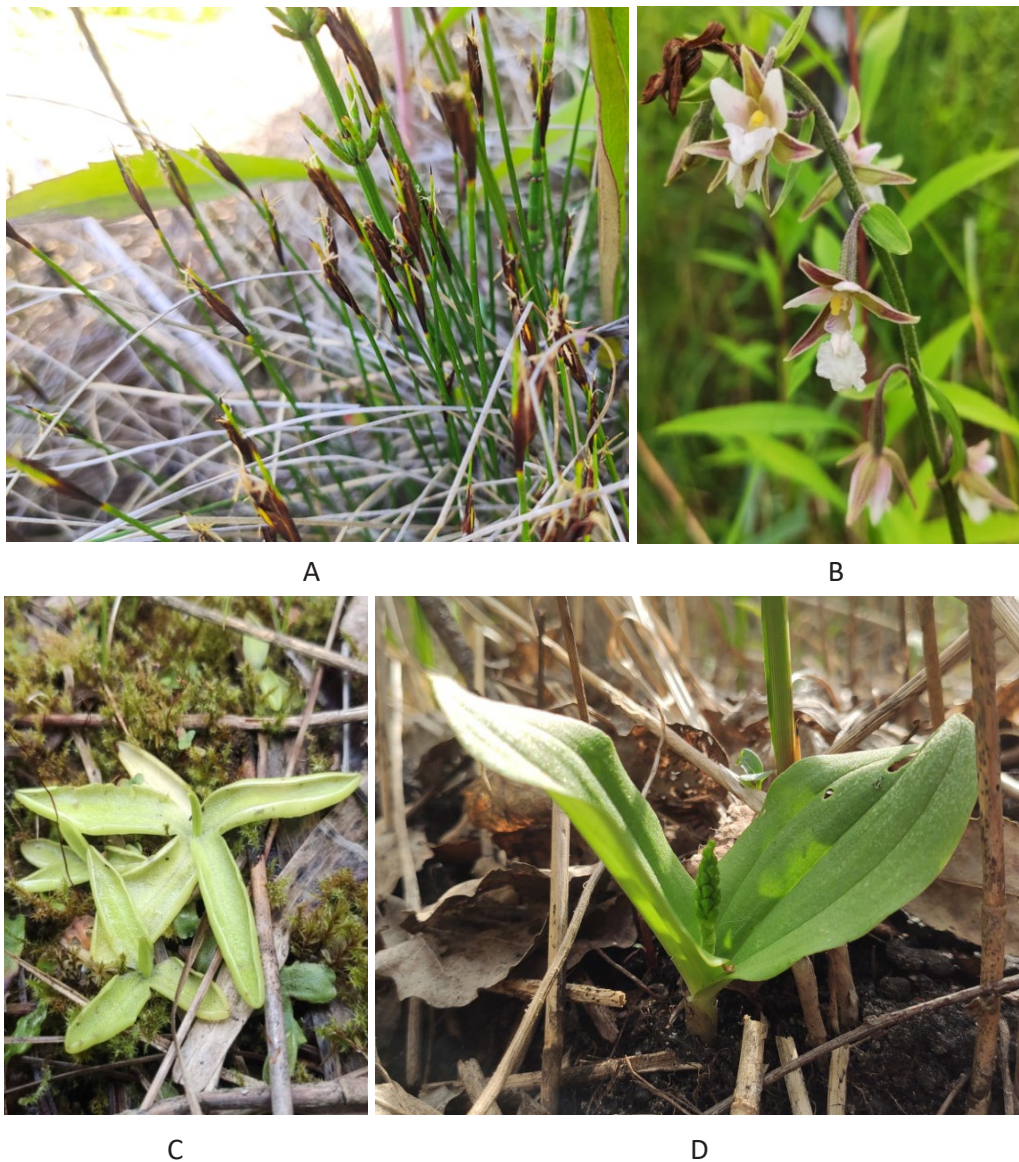
Рис. 2. Рідкісні рослини Білокриницького карбонатного болота : Fig. 2. Rare plants of the Bilokrynytsia calcareous fen : A – Schoenus ferrugineus L., B – Epipactis palustris (L.) Crantz., C – Pinguicula vulgaris L., D – Neottia ovata Bluff & Fingerh.