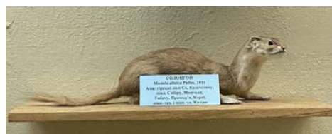
Рис. 1. Таксидермічні фігури Tragopan temminckii та Mustela altaica (роботи О. М. Пекла).