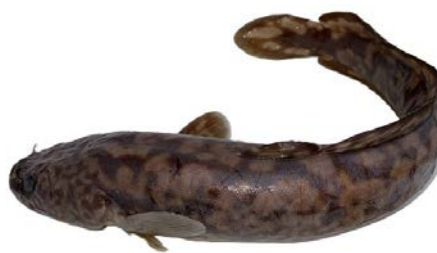
Рис. 7. Колекційний екземпляр Lota lota № 8059, 04.09.2003, м. Київ, Північний міст.