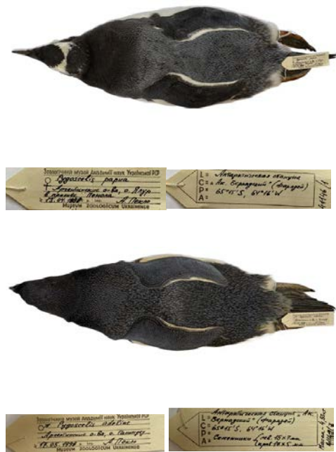
Рис. 4. Колекційні екземпляри Pygoscelis adeliae № 41149/7 та P. papua № 41146/1, здобуті О. М. Пеклом під час експедиції на станцію «Академік Вернадський».

• Larus dominicanus Lichtenstein, MHC, 1823 – 12 екз.; • Chionis albus (Gmelin, 1789) – 8 екз.; • Oceanites oceanicus Kuhl, 1820 – 4 екз.; • Stercorarius maccormicki Saunders, 1893 – 6 екз.; • Sterna vittata Gmelin, 1789 – 6 екз.; • Pagodroma nivea (G. Forster, 1777) – 4 екз.; • Leucocarbo atriceps (King, 1828) – 2 екз.; • Fregetta tropica (Gould, 1844) – 1 екз., • Pygoscelis adeliae (Hombron & Jacquinet, 1841) – 1 екз., • Pygoscelis papua (Forster, 1781) – 1 екз. (Рис. 4).