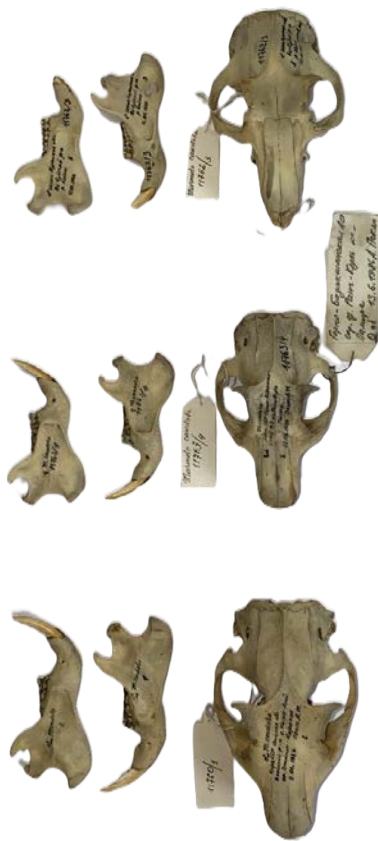
Рис. 9. Колекційні екземпляри Marmota caudata (черепи): № 11762/3, 12.07.1986, Киргизстан, Ак-Суйський р-н, оз. Іссик-Куль; № 11763/4, 13.06.1986, Таджикистан, Горно-Бадахшанська АО, оз. Ранг-Куль, Памір; № 11760/1, 09.06.1986, Киргизстан, Ошська обл., Алайський р-н, с. Кизил-Алай.

Того ж року, у червні, під час роботи в Таджикистані (Памір) він привіз до колекції Lepus capensis (3 черепи) та Marmota caudata (1 череп) (Рис. 9).