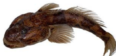
Рис. 6. Колекційний екземпляр Mesogobius batrachocephalus № 8208, 14.10.2004, м. Київ, Північний міст.