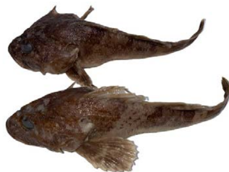
Рис. 5. Колекційні екземпляри Furcina osimae № 5908, 20–25.08.1983, бухта Кувшин, Японське море. Fig. 5. Collection specimens of Furcina osimae No. 5908, 20–25 August 1983, Kuvshin Bay, Sea of Japan.