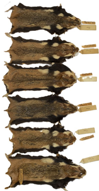
Рис. 8. Вибрані екземпляри Cricetus cricetus №№ 6927/75, 6924/72, 6925/73, 6936/84, 6923/71, 6926/74, 18.11.1977, м. Краснодар, п. Яблунівка.

ресом дослідника до цього виду (Рис. 8). У 2020 р. цей вид був офіційно визнаний таким, що перебуває під загрозою зникнення на всій території свого ареалу (Червоний список МСОП).