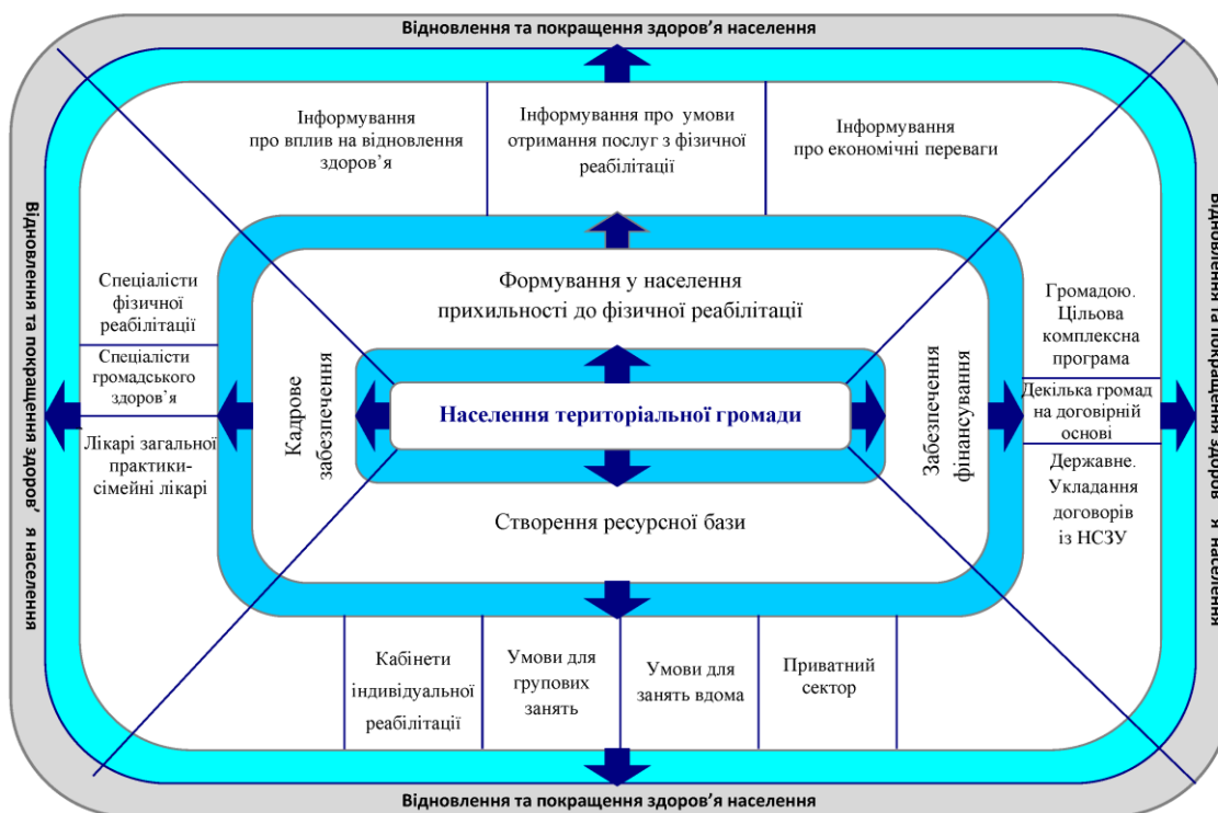
Рис. 1. Кластерна модель концептуальних підходів до забезпечення населення територіальних громад послугами із фізичної реабілітації в рамках системи громадського здоров'я

Нами розроблені концептуальні підходи до забезпечення населення територіальних громад послугами із фізичної реабілітації в рамках системи громадського здоров'я, які представлені на рис. 1 у вигляді кластерної моделі.