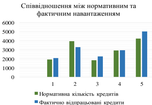
Рис. 2. Порівняльний аналіз отриманих результатів