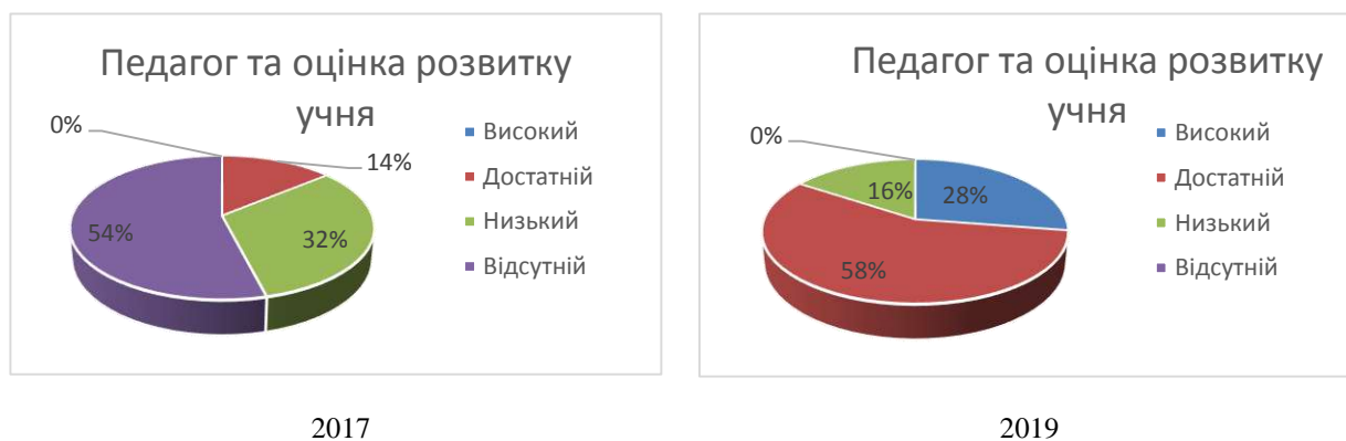
Рис. 3. Рівень знань, навичок, умінь щодо організації та здійснення діагностичної діяльності

В ході дослідження виявлено, що знаннями, навичками та вміннями здійснювати комплексну оцінку розвитку дітей володіли далеко не всі, хто прийшов підвищити свій професійний рівень до магістратури.