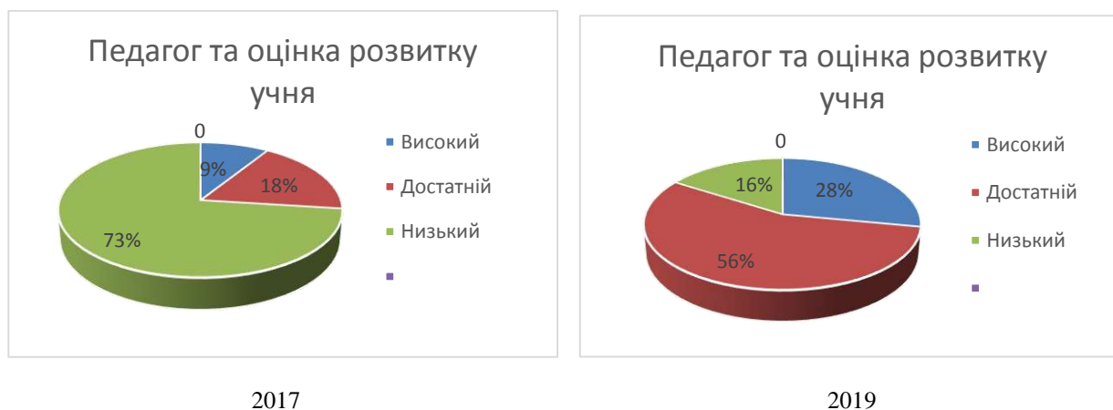
Рис. 4. Готовність педагогів до діагностики розвитку дітей

Підсумковим показником професійної діяльності випускника закладу вищої освіти є його готовність виконувати посадові функції. Готовність працювати в закладі спеціальної чи інклюзивної освіти, діагностувати дітей з особливими освітніми потребами, організувати їх спільне навчання з однолітками, коректно оцінювати їхні здобутки першокурсники проявили на високому й достатньому рівні лише 27% педагогів, решта 73% на низькому рівні. Вважаємо, що першу категорію педагогів, тобто ті, які володіють певною мірою діагностико-прогностичною компетентністю, склали колишні працівники психолого-медико-педагогічних консультацій, які працювали і відповідно мали практичний досвід в організації діагностичної діяльності. Найрозповсюдженою відповіддю серед першокурсників була така: «Мені не вистачає спеціальних знань, а також знань про особливості розвитку дітей з обмеженими можливостями здоров'я» (рис. 4).