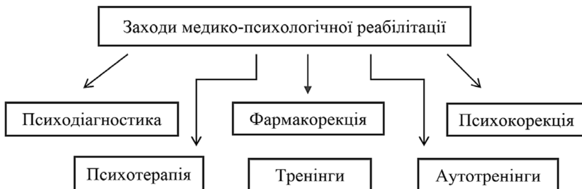
Рис. 2. Заходи медико-психологічної реабілітації

Заходи медико-психологічної реабілітації проводять: психологи, медичні працівники, військові психологи зі складу позаштатних груп психологічного забезпечення, за необхідністю – представники громадських та волонтерських організацій, що спрямовані до проведення заходів із психологічної реабілітації та представники духовенства (рис. 2).