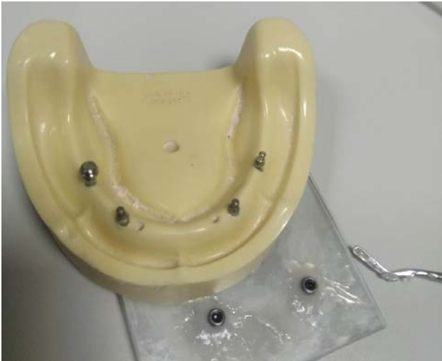
Рис. 2. Фото моделі нижньої щелепи з установленими мініімплантатами на етапах експерименту

Облік результатів проводили в електронних таблицях Microsoft Excel 2016, де й було проведено попередній аналіз результатів та застосовано тести описової статистики. Тести порівняльної статистики було виконано з використанням пакетів Microsoft Excel 2016, BioStat LE, SPSS/Statistica/Python. Нормальність даних оцінювали за допомогою тесту Шапіро-Уїлка. Для порівняння значень сили ретенції між п'ятьма групами було застосовано однофакторний дисперсійний аналіз (ANOVA). Попарні порівняння « post hoc » проводили за допомогою тесту Тьюкі HSD. Рівень статистичної значущості було встановлено на рівні p < 0,05 . Розмір ефекту розраховували за допомогою ета-квадрату ( \eta^2 ).