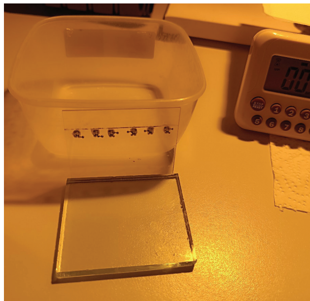
Рис. 1. Брекет-замки з ортодонтичним композитом, фіксовані до пластини з органічного скла до експозиції в термостаті

стата та візуально оцінювали зміщення брекет-замка за допомогою калібрувальної лінійки «Microscope Micrometer Calibrating Ruler». Отримані дані переносили в електронні таблиці MicroSoft Excel, де проводили їх статистичну обробку. Для простого аналізу були застосовані методи описової статистики. З огляду на невелике число дослідних зразків в кожній підгрупі дослідження, для порівняльної статистики було використано непараметричний критерій Краскела–Уолліса, для постхок-аналізу застосували тест Данна з поправкою Бонферроні. За рівень вірогідності різниці між підгрупами було прийнято значення показника p = 0,05 .