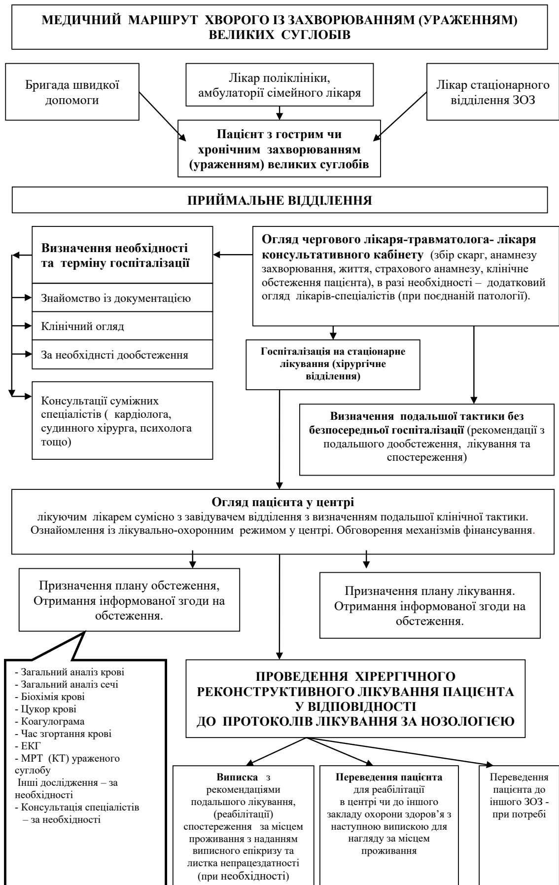
Рис. 2. Медичний маршрут населення – пацієнтів при захворюваннях та ураженнях великих суглобів