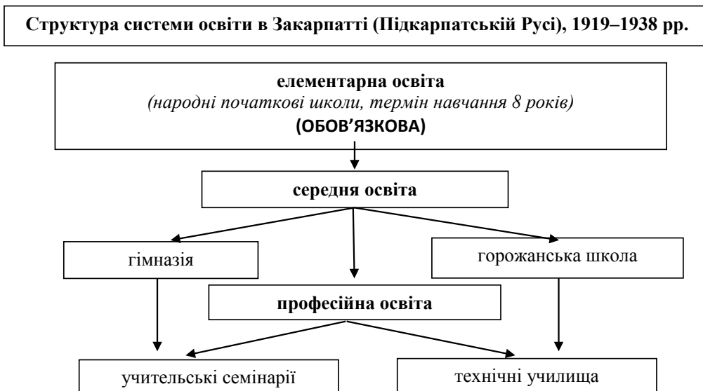
Рис. 2. Структура системи освіти в Закарпатті (Підкарпатській Русі), 1919-1938 рр.

Отже, чехословацьким урядом було прийнято та введено в дію 1922 р. «Малий шкільний закон на Чехах» [4, с. 91–94], який переважно поширювався на території Чехії, Моравії та Сілезії, тоді як на території Словаччини та Підкарпатської Русі поряд з цим законом все ще зберігалися норми Закону XXXVIII «Про народну освіту» (1868). У 1927 р. до Реферату шкільництва в м. Ужгород було надіслано проєкт Закону реформи шкільництва в Чехословацькій республіці [6]. Проведення освітньої реформи в 20–30 рр. призвело до низки системних змін, які переважно відобразилися в підходах щодо розширення мережі навчальних закладів, уведенні обов'язкового восьмирічного шкільного навчання, збільшенні кількості годин на вивчення рідної мови, математики, природознавства, науки про рідний край, визначенні системи штрафів для батьків, діти яких не відвідували школи тощо. На необхідність обов'язкової восьмирічної освіти вказував той факт, що близько 30% учнів школоповинного віку залишалося поза навчанням «по случаю смерти родителів; по болезни самихъ детей: чесоткой, головными болями и лихорадкой; по болезни членов семьи; а в зимние и весенние месяцы по случаю больших сильныхъ морозов; за неимением у детей теплої одежды и соответствующей обуви; въ виду бедности их родителей; невозможная дорога и отсутствие мостов» [8]. Наприкінці 30-их років ця цифра скоротилася до 8%.